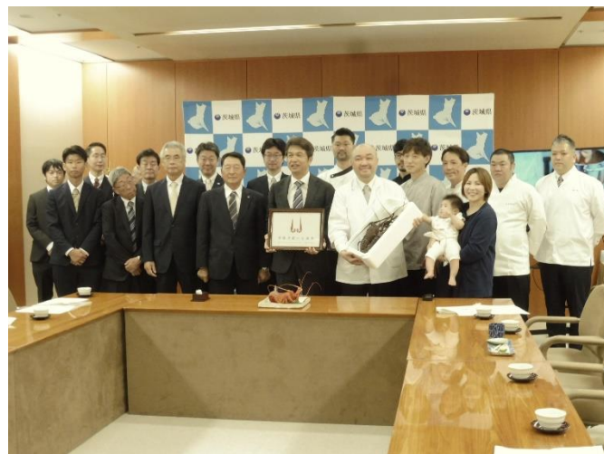
↑知事と訪問者一同による記念撮影。