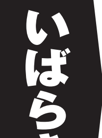
<茨城1区> たどころ 田所よしのり たどころ 田所よしのり