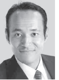
<栃木3区> かずお やな 和生 かずお やな 和生