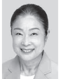
<埼玉13区> しなご つちや 品子 しなご つちや 品子