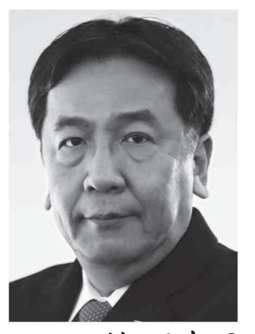
立憲民主党 代表 萩野幸男