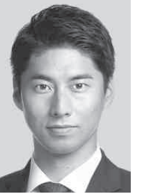
<群馬1区> なかそね 中曽根やすたか なかそね 中曽根やすたか