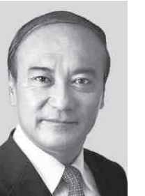
<埼玉11区> こいずみ 小泉りゅうじ こいずみ 小泉りゅうじ