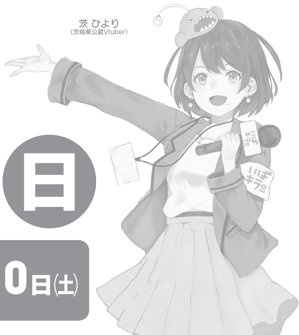
茨ひより (茨城県公認Vtuber)