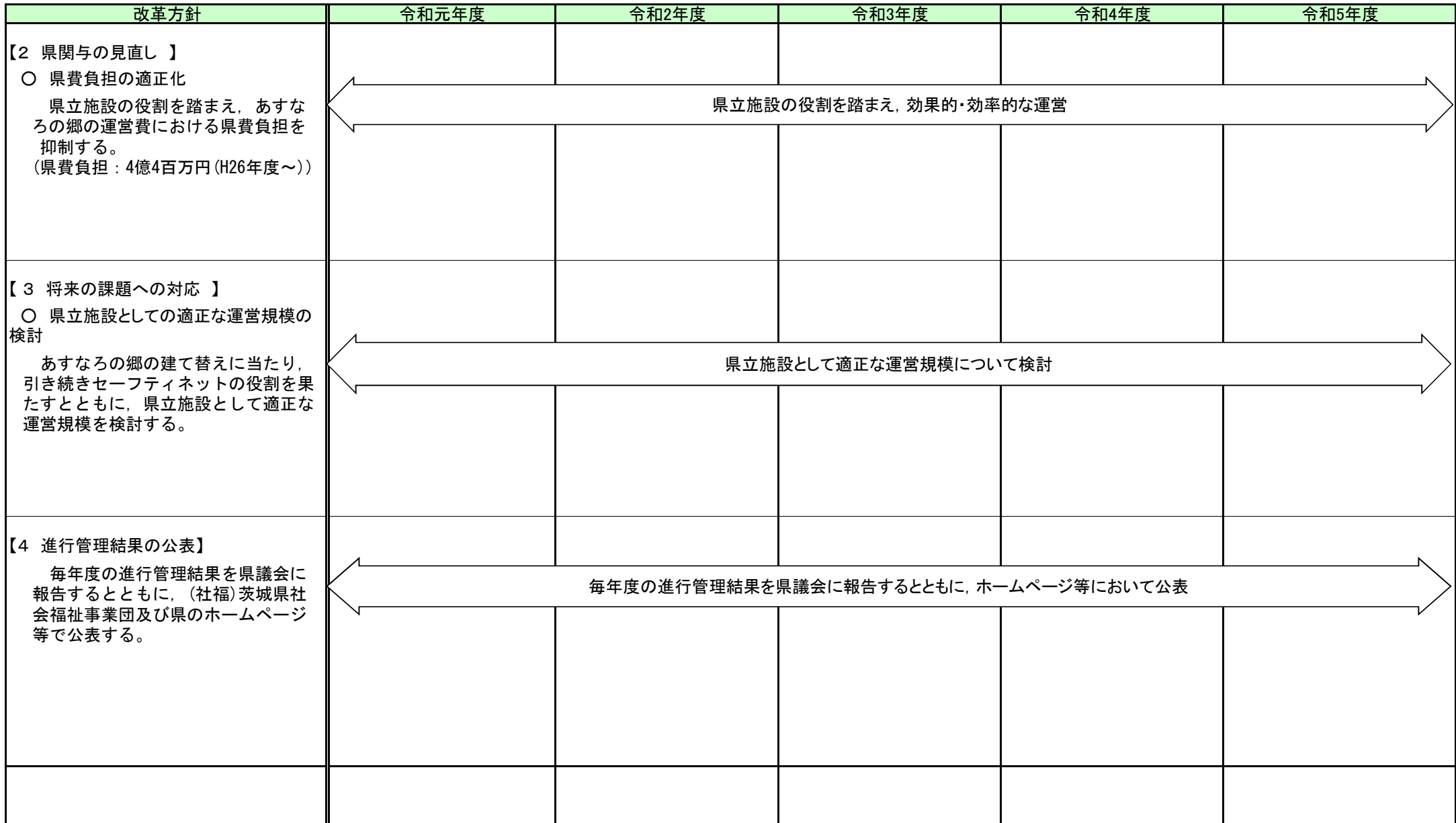
改革工程表2(年度別実行計画)