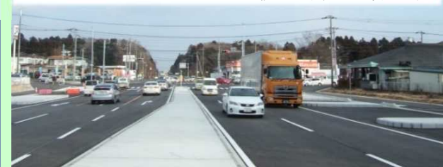
【整備後】菅谷飯田線(堀之内交差点)の利用状況