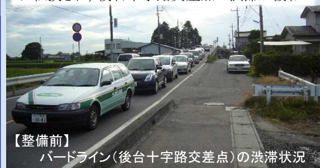
【整備前】 バードライン(後台十字路口交差点)の渋滞状況

広域農道バードラインの交通量が菅谷飯田線に転換され, 後台十字路口交差点の渋滞が緩和