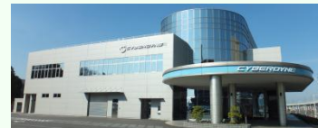
サイバーダイン研究所