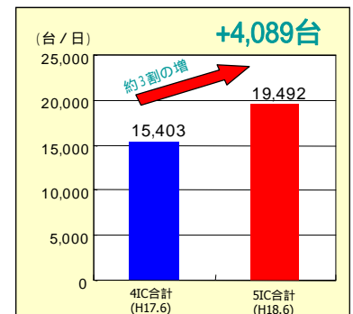
周辺ICを含めたETC利用台数

4IC: 水戸IC、友部IC、岩間IC、茨城町西IC 5IC: 友部SAスマートICと上記4IC