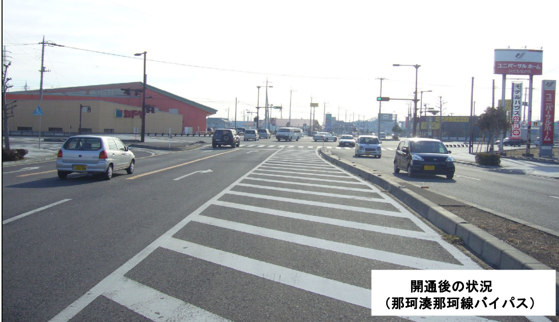
開通後の状況 (那珂湊那珂線バイパス)