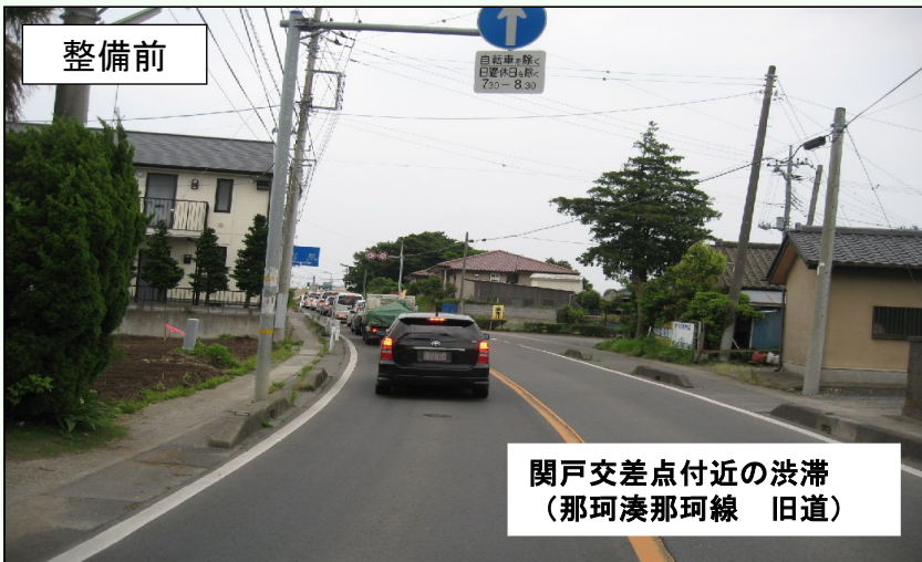
関戸交差点付近の渋滞 (那珂湊那珂線 旧道)