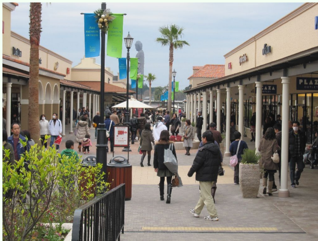
買い物客で賑わうアウトレット