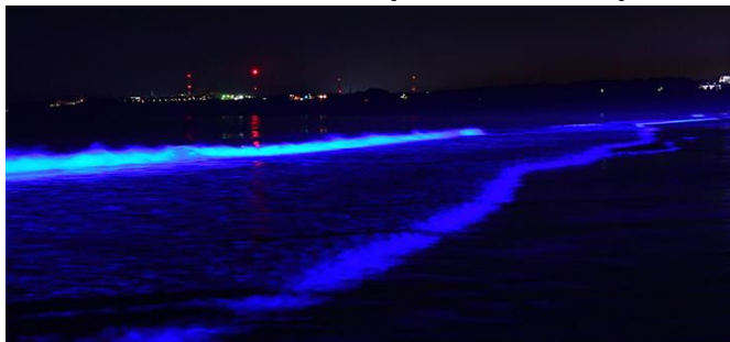
※写真は昨年の様子

冬の澄んだ空気が流れる大洗の海岸。「NIGHT WAVE」はそんな海岸と調和し、波があたかも青白く発光しているかのようにライトアップするイベントです。通常のイルミネーションではなく、自然を活かした光の演出として、波が弱い時には繊細に、波が高い時には力強く、そして幾重にも重なる波など、多種多様な表情を表現します。