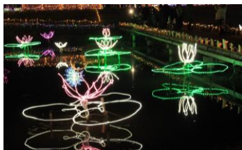
※写真は昨年の様子

この風車は、土浦市市制施行50周年を記念して建設されたもので、住民から愛される街のシンボルです。砂ろ過装置が設置されており、霞ヶ浦の水を取り入れて浄化する役割も果たしています。