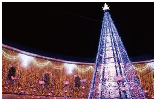
※写真は昨年の様子

さらに、2014年国際デザインコンペティション「ブルネル賞駅舎部門」で優秀賞を受賞し、“世界で最も美しい駅舎の一つ”として高く評価されているJR日立駅でも「冬のさくらまつり」をテーマにライトアップが実施されます。桜色から暖かい陽の光色に変わるLEDの色の変化と桜の花のデコレーションを使用して駅構内に桜のトンネルを表現します。辺り一面が桜色に包まれた空間は、日立シビックセンター新都市広場とは一味違った幻想的な雰囲気を作り出します！